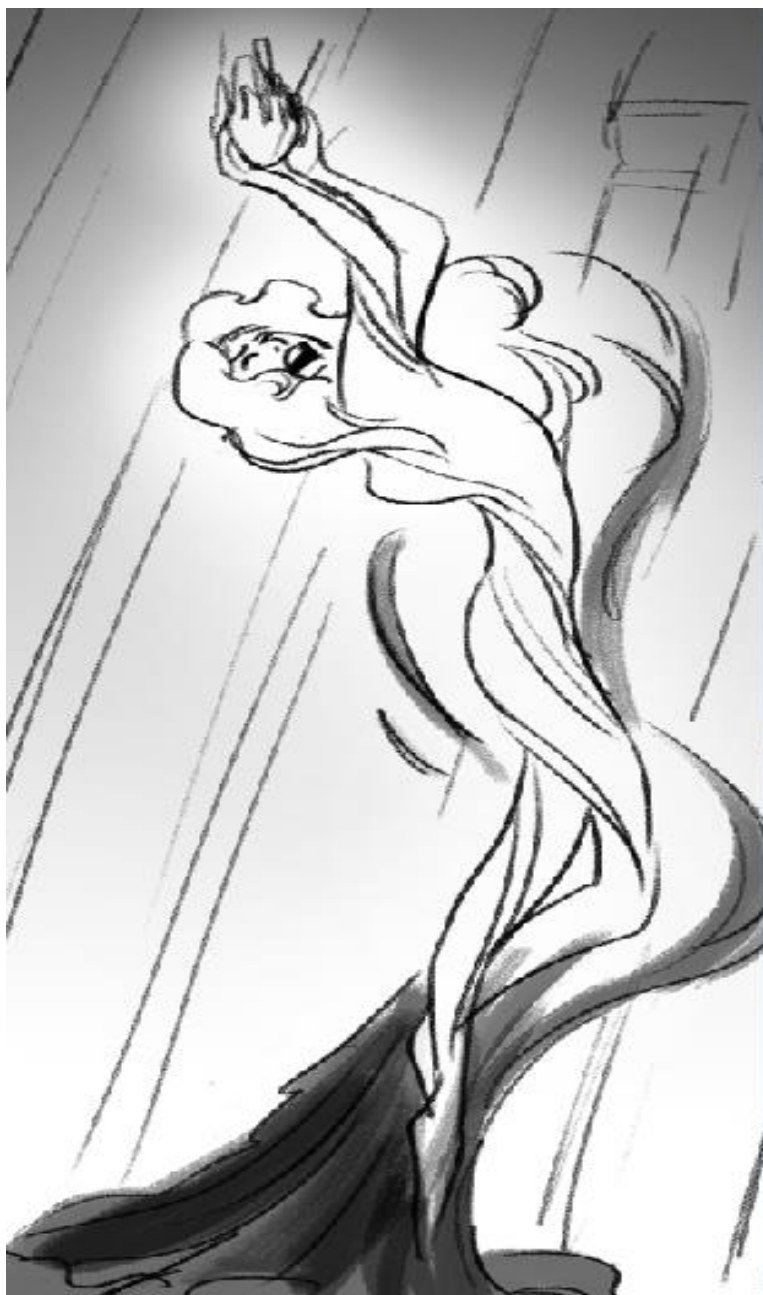
Da un'immagine di Flavia De Vita per 'The Lazahars'